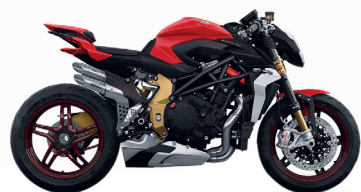
ROSSO SHOCK PERLATO OPACO/ CARBONIO CON FILO ROSSO OPACO

E10 SOLO BENZINA SENZA PIOMBO ETANOLO FINO AL 10% DI VOLUME