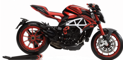
ROSSO SHOCK PERLATO/NERO CARBON MET