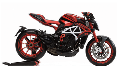
ROJO SHOCK PERLADO/NEGRO CARBON METALIZADO