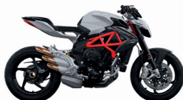
GRIGIO GHIACCIO/GRIGIO AVIO