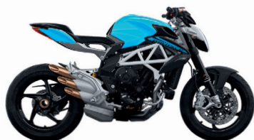
BLU LUCE/GRIGIO NOTTE

MV Agusta is committed to the constant improvement of our products. Therefore the information and technical characteristics of the vehicles are subject to change without notice.