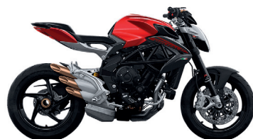
ROSSO FUOCO/GRIGIO NOTTE