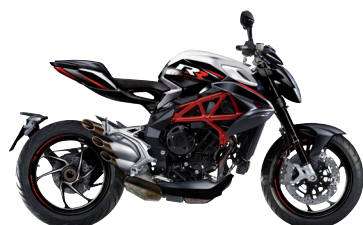
BIANCO ICE PERLATO/NERO CARBON MET.