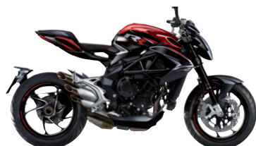
ROSSO SHOCK PERLATO/NERO CARBON MET.

MV Agusta è impegnata in una politica di continuo miglioramento dei propri prodotti. Pertanto le informazioni e le caratteristiche tecniche dei veicoli possono essere oggetto di modifiche senza preavviso.