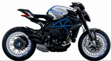
HIELO BLANCO PERLADO/AZUL AMERICA