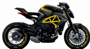
NERO INTENSO OPACO/GIALLO PIRELLI

E10 SOLO BENZINA SENZA PIOMBO ETANOLICO FINO AL 10% DI VOLUME