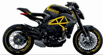
MATT SCHWARZ/PIRELLI GELB