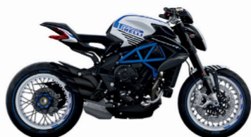
BIANCO ICE PERLATO/BLU AMERICA