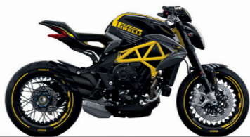
NECO INTENSO OPACO/AMARILLO PIRELLI