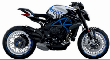
PERL WEISS ICE/BLAU AMERICA

MV Agusta arbeitet ständig an der Verbesserung seiner Produkte. Daher können sich die Informationen und technischen Details der Fahrzeuge ohne vorherige Ankündigung ändern.